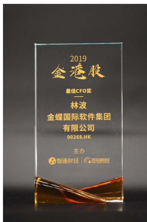
金蝶國際獲得「最佳港股通公司」和「最佳CFO」獎項

「2019金港股年度頒獎盛典」由智通財經和同花順財經共同主辦。「金港股」目前已行至第四屆，在過去的第三屆論壇裡，超過7萬億市值企業參與，其中九成均為港股通標的成員，受到超過600萬港股投資人的矚目，已成為全球最大最專業的港股上市公司評選，以及反映年度最具投資價值及成長潛力港股的投資風向標。本屆金港股評選由香港中資證券業協會領銜，多位經濟學家、多家香港知名券商及頂級投資人士組成的專家評審團對參評公司過往一年的業績、股價漲幅、股票活躍度、社會責任、信息合規等進行研究篩選和權重評分。